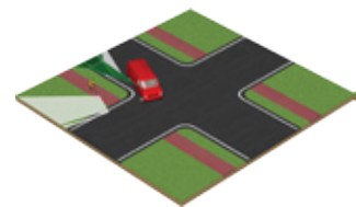
Huidig zichtveld met 'banaanspiegel', zonder DOBLI®